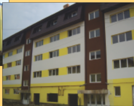
Bloc locuințe sociale pe str. Luncii