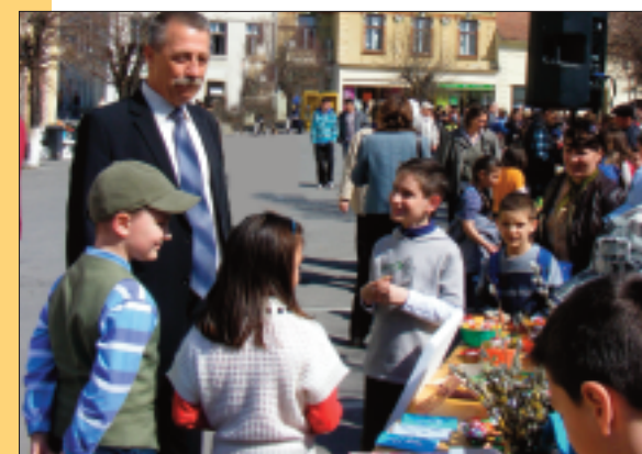
Bazarul de Paști