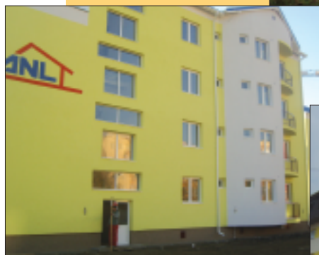
Bloc locuințe ANL