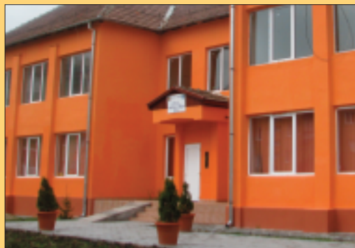
Creșa din Cartierul Gura Câmpului