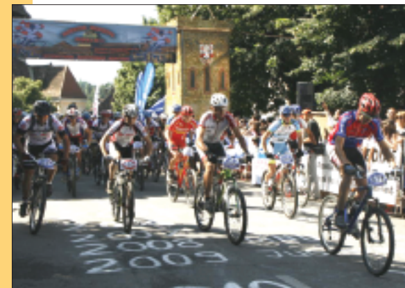
Maratonul Medieval Mediaș

Vom organiza în acest an peste 200 de evenimente culturale sportive printre care amintim: „Bazarul de Paști”, Festivalul „Mediaș – cetate medievală, târg de meșteșuguri vii”, concursul de mountainbike „Maratonul Medieval Mediaș”, concursul de atletism „Maratonul Internațional Transilvania”, „Festivalul Cititorului”, „Săptămâna Tinerețului Medieșean” etc.