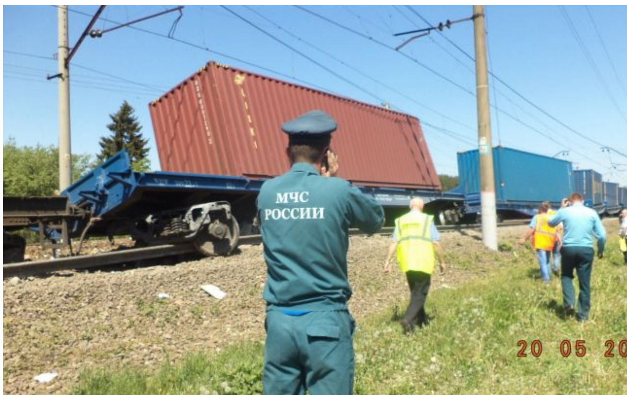
Containerele deraiate, care au provocat accidentul.

Caile Ferate Ruse au anuntat ca 16 containere ale marfarului au deraiat si au ras caroseria laterala a trenului de pasageri. Au fost afectate vagoanele 7 si 8 ale trenului de pasageri. Circulatia feroviara pe acest segment a fost sistata. Motivul accedentului a fost o defectiune a marfarului, anunta Ria Novosti, citand surse din cadrul CFR-