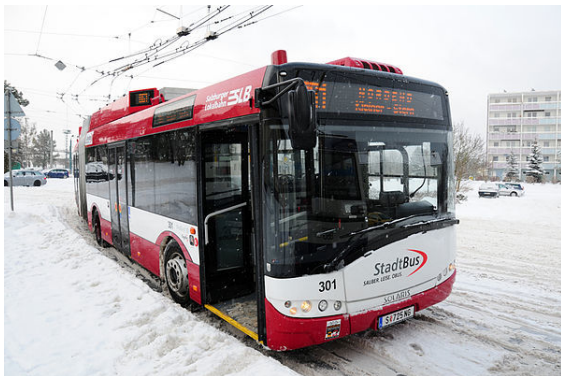
Januar 2010: Solaris Trollino 18 im Testeinsatz