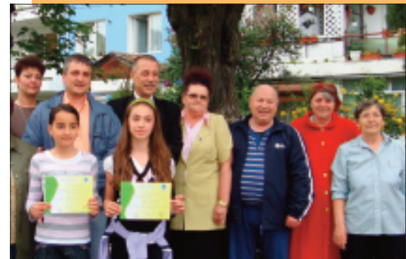
Cea mai bună asociaţie de locatari din Concursul Eco-Sal

■ S-a mărit la 233 numărul străzilor salubrizate.