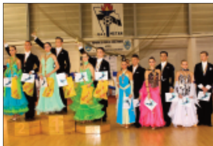
Concurs dans sportiv

Pe plan cultural-sportiv, se anunță un an bogat în evenimente și activități organizate deopotrivă de municipalitate și de ONG-urile din oraș. În ultimii ani, au fost organizate evenimente cultural - sportive pentru toate gusturile și pentru toate vârstele.