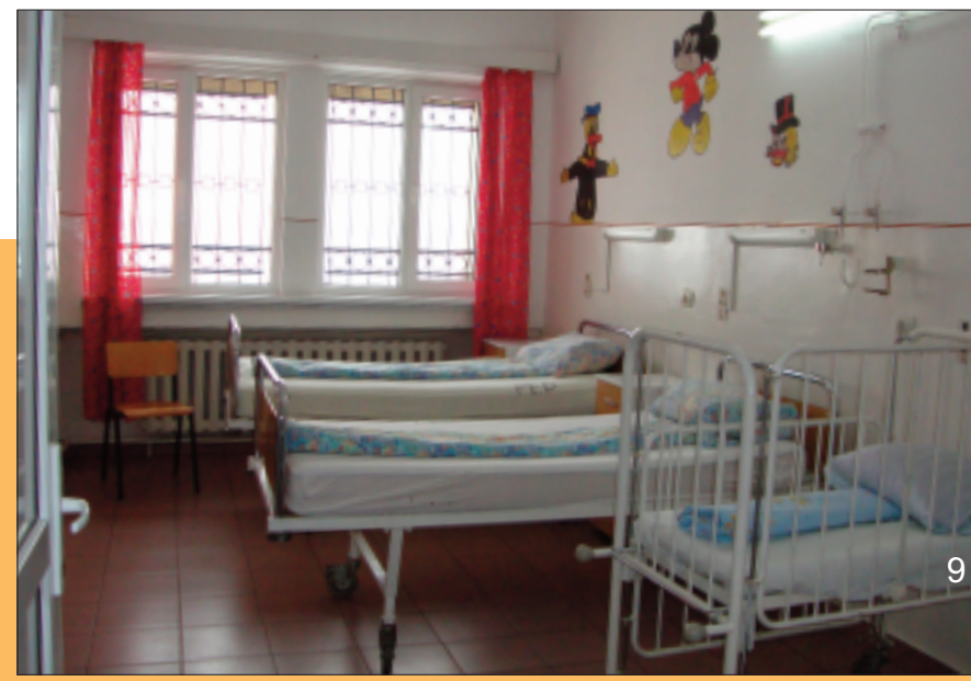
Salon spital reabilitat cu fonduri de la S.N.G.N Romgaz S.A.

Anul acesta va continua seria de proiecte și investiții menite să crească confortul pacienților prin anveloparea termică și reparația capitală a rețelei interne de încălzire centrală. Totodată, se va monta o centrală termică nouă cu cogenerare energie electrică în sistem de finanțare ESCO, se va finaliza construcția unui lift exterior (derulare) și reabilitarea fațadei pentru pavilionul Interne, dotarea cu o fabrică de oxigen medicinal. Toate aceste proiecte și investiții sunt sau vor fi finanțate cu bani de la bugetul local, Ministerul Sănătății sau sponsori.