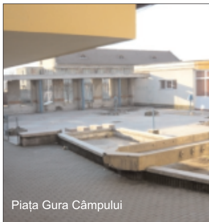
Piața Gura Câmpului