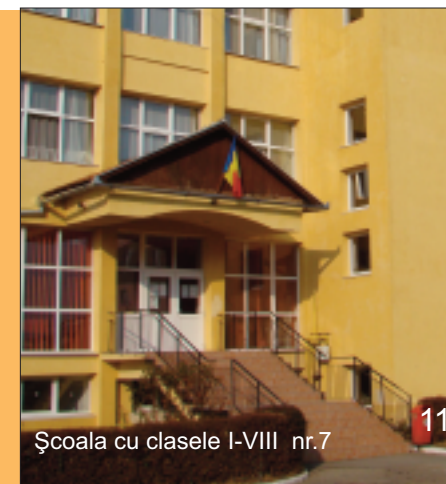
Școala cu clasele I-VIII nr.7

De asemenea, în cadrul Școlii cu clasele I-VIII Mihai Eminescu se vor executa lucrări de modernizare și extindere.