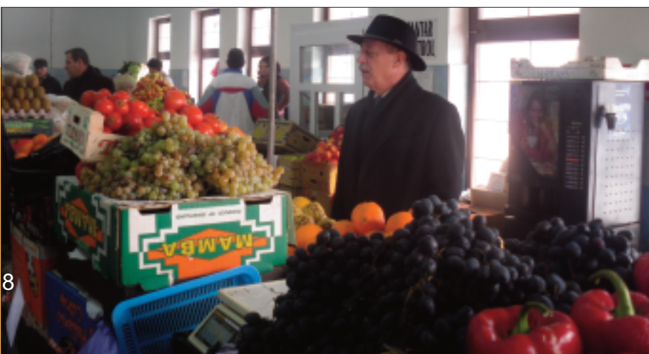
Primarul Teodor Neamțu în Piața Centrală.