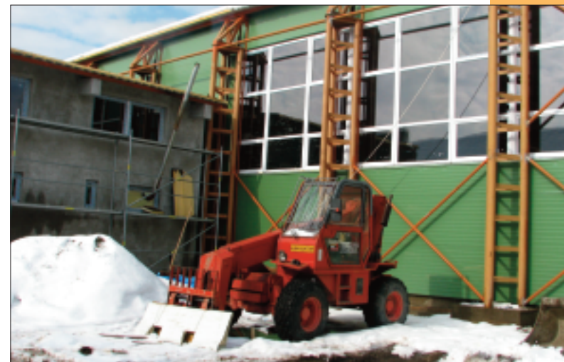
Sala de sport de la Școala cu clasele I-VIII nr.5

■ Plombe asfaltice și reparații trotuare cu asfalt în suprafață de 30.000 mp pe străzile: 1 Decembrie, Sibiului, I. Agârbiceanu, Baznei, Al. Cel Bun,