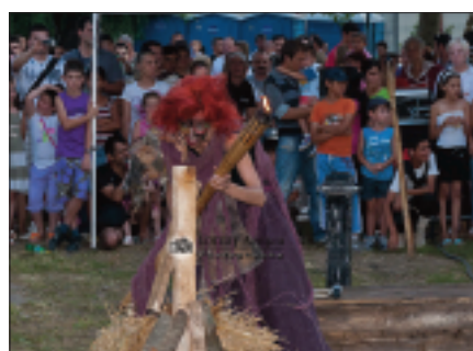
Festivalul de artă medievală